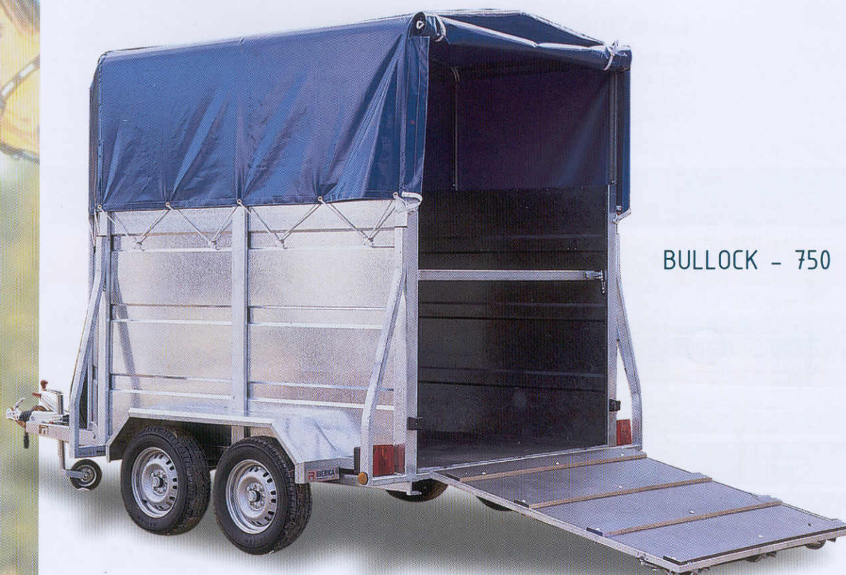
BULLOCK - 750